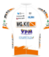
MG.K VIS VPM