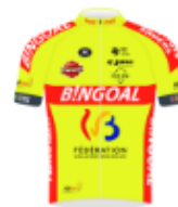
BINGOAL PAUWELS SAUCES