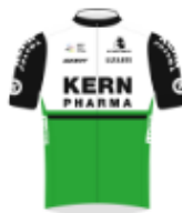
EQUIPO KERN PHARMA