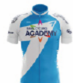
ISRAEL CYCLING ACADEMY