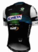
KOMETA CYCLING TEAM