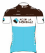
AG2R LA MONDIALE