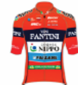
NIPPO VINI FANTINI